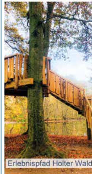
Erlebnispfad Holter Wald